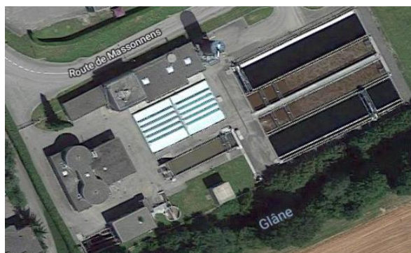
Avec la station d'épuration de Romont

Les STEP de Romont et Autigny doivent investir prochainement afin d'assainir leurs ouvrages, et augmenter leur capacité de traitement en raison du développement démographique et industriel des 15 communes membres.